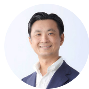
博報堂生活総合研究所 所長

博報堂では2024年4月に「研究デザインセンター」を立ち上げ、博報堂DYグループの競争優位の源泉である「生活者発想」の研究・開発機能を強化しています。独自の調査などを通じた生活者に関する先端情報およびナレッジの収集、大学・社外企業・研究機関との連携・研究ネットワークも活用し、生活者発想に関する基礎研究、ソリューション開発を含めた応用研究を行っています。グループ内での知見共有、クライアントへの価値提供にとどまらず、継続的な情報発信により、生活者発想の普及啓発にも積極的に取り組んでいます。