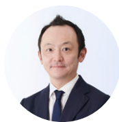
博報堂生活者発想 技術研究所 所長